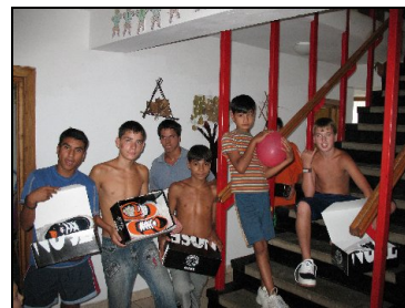
Copii din Orfelinatul Perisoru primind incaltaminte noua

Sunt aproximativ 150 de copii care locuiesc in Orfelinat, In timpul vacantei de vara, copii sunt incurajati sa-si viziteze parintii si rudele pe care le mai au. Asa ca in orfelinat au fost aproximativ 70 de copii care au participat la programele noastre. Acestia sunt cei care nu aveau unde sa se duca, povestea ficaruia dintre ei este o tragedie, chiar daca parintii unora le traiesc, durerea cea mai mare e ca ei sunt abandonati chiar de propria lor familie. In unele din cazuri Autoritatea a trebuit sa intervina pentru ca situatia copiilor era tragica acasa. In aceste cazuri orfelinatul de stat este o alternative pozitiva, dar este ultimul loc unde un copil isi doreste sa ajunga, fiecare din ei isi doreste o familie care sa-l iubeasca. In momentul de fata 4 din fetele din Casa Betania sunt din acest orfelinat. Acesta este una din binecuvantarile pe care Dumnezeu le-a lasat in urma acestei tabere.